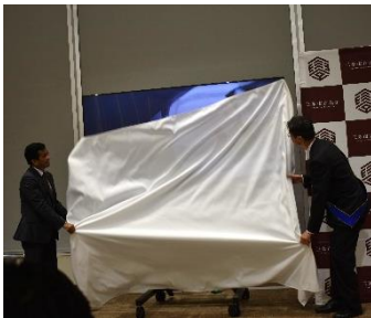
液晶テレビの除幕