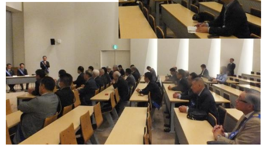
報道関係者の取材対応