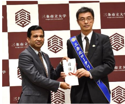
目録の贈呈 「SONY 4K 液晶テレビ 85型」