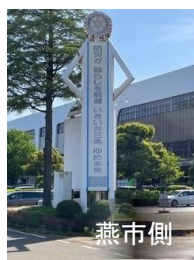
三条駅自由通路 掲示ポスター