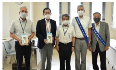
社会奉仕事業 温度計66台寄贈