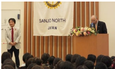
社会奉仕事業 尾木直樹氏講演会