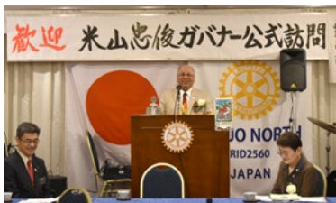
米山ガバナー公式訪問