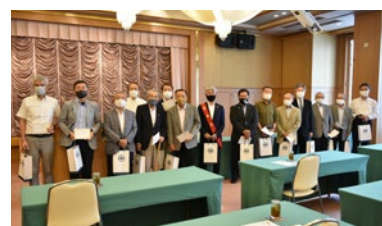
マスク姿の100出席表彰