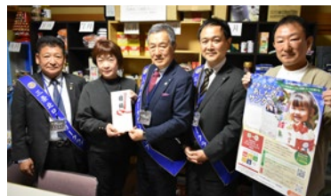
社会奉仕事業 フードバンク X'masケーキ贈呈