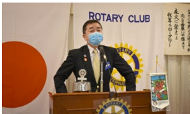
感染防止 マスク姿会長挨拶