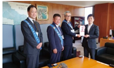
社会奉仕事業 まちやま ソメイヨシノ寄贈