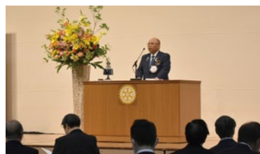
地区研修・協議会 (米山ガバナー)