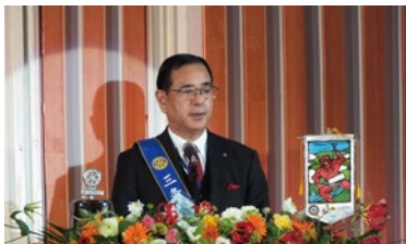
創立30周年記念式典