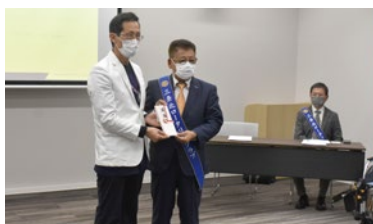
社会奉仕事業 県中央基幹病院 車椅子・液晶ディスプレイ寄贈