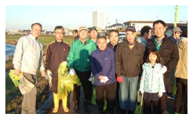
五十嵐川クリーン作戦参加