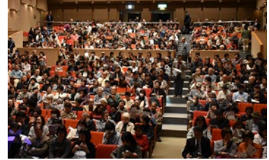
社会奉仕事業 二胡演奏者 野沢香苗演奏会