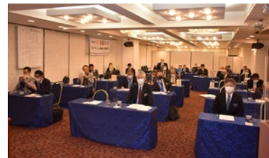
アクリル板・マスク姿の例会