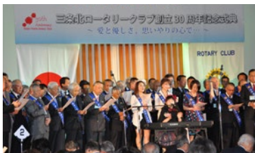
創立30周年記念式典