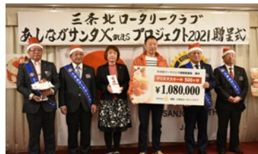
社会奉仕事業 フードバンク X'masケーキ贈呈