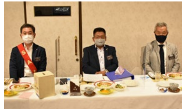
第一例会 (アクリル板あり)