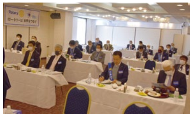
感染防止 スクール型の会場