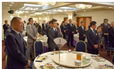
三条東RC合同夜例会