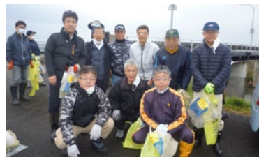
五十嵐川クリーン作戦参加