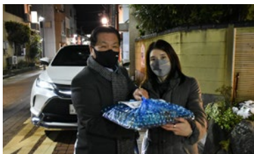
コロナ禍ドライブスルー新年会