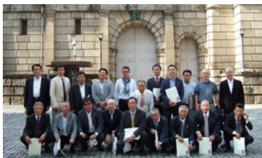
日本銀行見学と大相撲観戦 親睦旅行