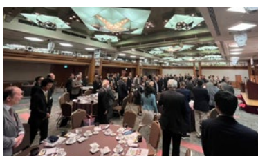
親睦旅行（銀座RC訪問）