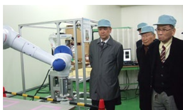
企業訪問 (株)ワイ・イー・データ様