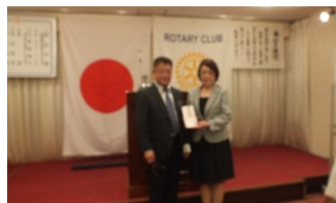
フードバンク X'masケーキ贈呈