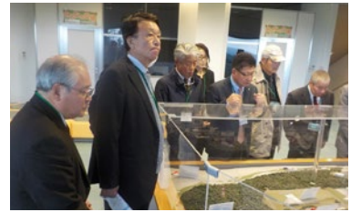
移動例会 東京電力柏崎刈羽原子力発電所見学