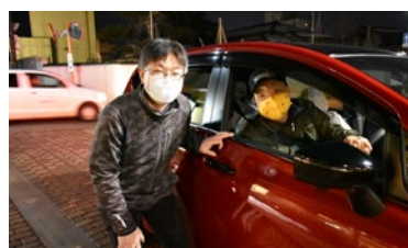
ドライブスルー持ち帰り新年会