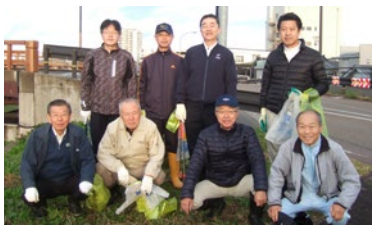
五十嵐川クリーン作戦参加