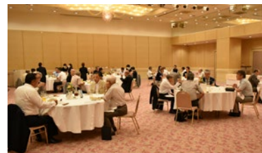
歴代会長からクラブを語ってもらう夜例会