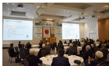
親睦旅行 (大阪RC訪問)