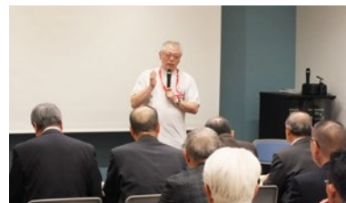
職場見学 社会医療法人 立川メディカルセンター 立川総合病院