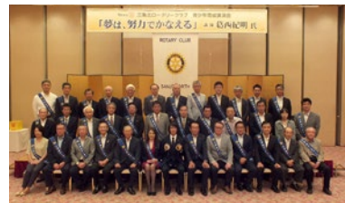
社会奉仕事業 葛西紀明氏 講演会