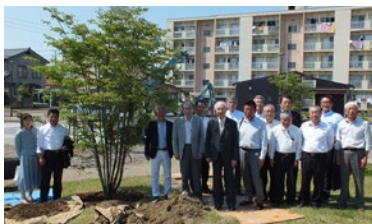
社会奉仕事業 ヤマボウシ植樹