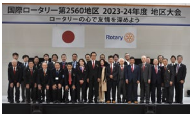
地区大会（米山ガバナー）