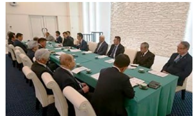
ファイヤーサイドミーティング