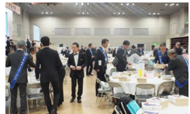
川瀬年度 地区大会 コ・ホストクラブ