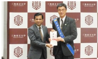
三条市立大学 液晶テレビ寄贈